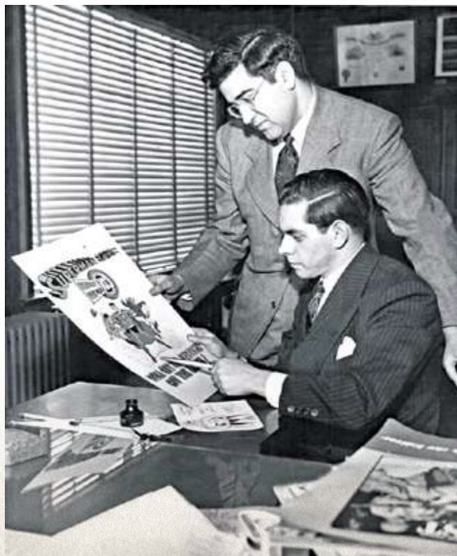
Jerry Siegel et Joe Shuster, les créateurs de Superman, le premier des super-héros, créé en 1938.

En rapprochant la figure de Superman de celle de John Steele, tous deux liés à la ville de Metropolis, l'exposition instaure d'emblée un dialogue original entre héroïsme de fiction et destin historique.